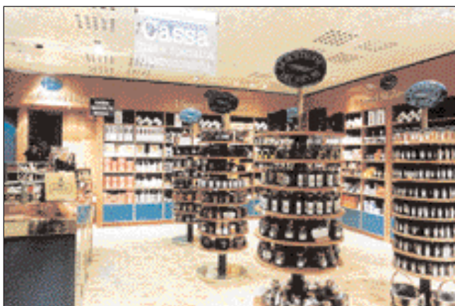
Il punto vendita all'interno della Rinascente di Milano (anni '90).

ciò lasciava largo spazio alla possibilità di imporsi sul mercato