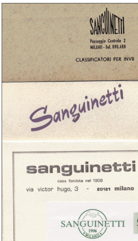
L'evoluzione del marchio negli anni

Iniziativa realizzata in collaborazione con il Centro per la cultura d'impresa