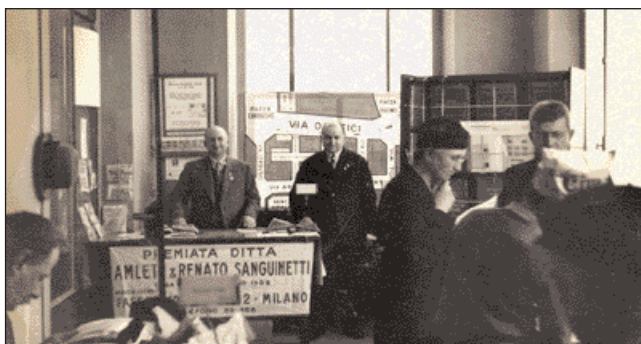
Amleto e Renato presentano il proprio stock alla Mostra filatelica del 1934

D i piccolo formato, verticale, il profilo della regina Vittoria stampato in bianco e nero: così si presentava il penny black, il primo francobollo, stampato in Inghilterra nel 1840 in seguito alla riforma delle poste inglesi voluta da sir Rowland Hill. Come ci raccontano Orlando Sanguinetti e suo figlio Oscar, la filatelia nacque quasi contemporaneamente; la famiglia Sanguinetti è stata testimone diretta di circa due terzi della storia ultracentenaria di questo hobby.