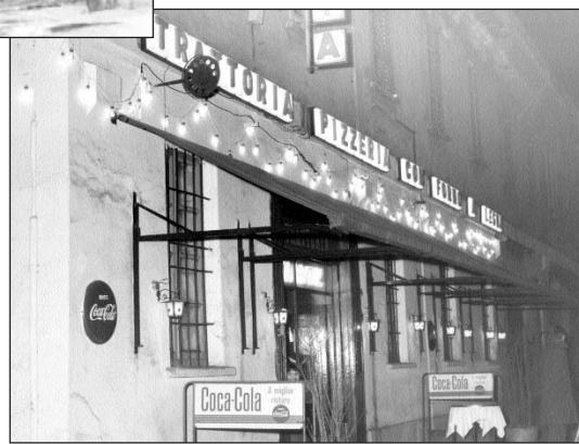
La prima insegna: trattoria e pizzeria con forno a legna (anni '70).

da sigle o colori, e i gestori dovevano tenerle a bagnomaria. Consumavano bevande che costituivano quasi un identificativo sociologico della categoria