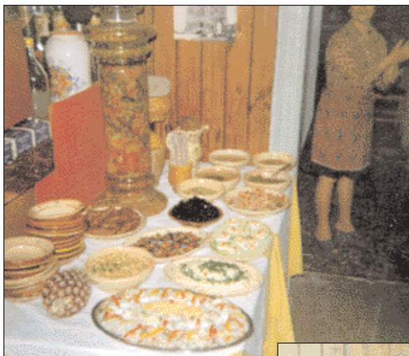
In alto: Il cliente viene accolto con un ricco buffet di antipasti (fine anni '80).

Gli elementi di crisi degli anni '90, viceversa, non hanno inciso sull'attività serale e festiva. Il locale può contare su una clientela fissa e selezionata cui si aggiungono le cene di rappresentanza richieste dalle imprese. La buona conoscenza delle lingue straniere e l'apertura anche nel mese di agosto consentono alle imprese di indirizzare con tranquillità al ristorante i