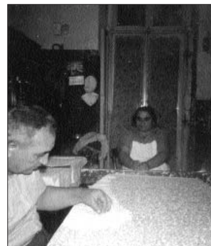
L'essiccazione delle orecchiette: la cura dei piccoli dettagli (foto anni '70).

Con l'inizio degli anni '70, dunque, la situazione ini- ziò a cambiare. Innanzitutto un maggior benesse-