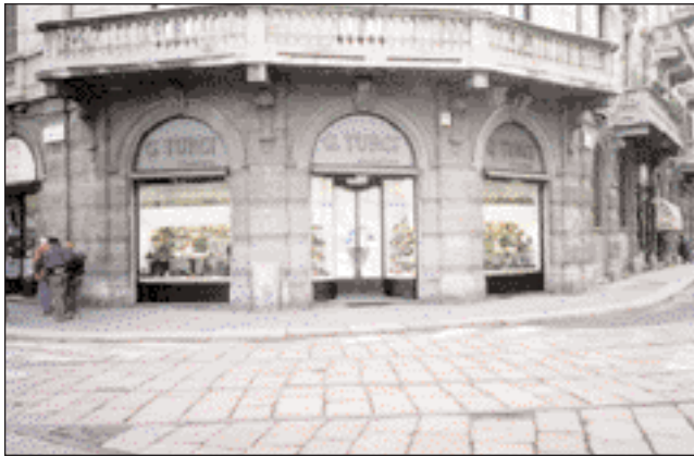
Le vetrine del negozio G. Turci Calzature