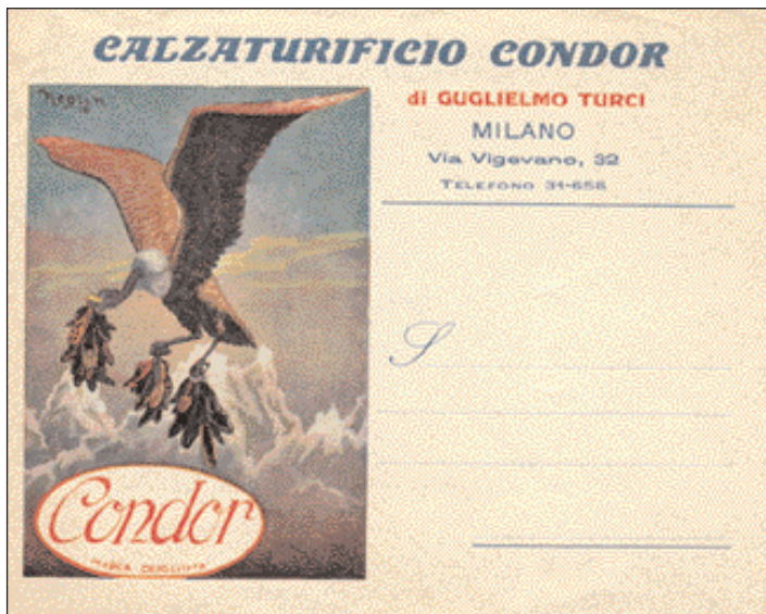
La carta intestata del Calzaturificio Condor

Iniziativa realizzata in collaborazione con il Centro per la cultura d'impresa