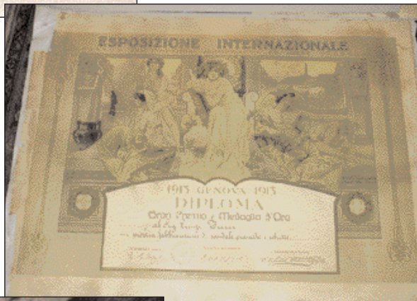
Il diploma ricevuto dal Calzaturificio in occasione dell'Esposizione di Genova del 1913

a quelli ottenibili attraverso la commercializzazione di prodotti di fascia medio/alta.