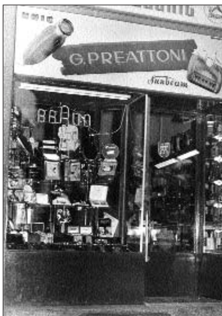
I cambiamenti estetico-commerciali nel tempo: il negozio di via Manzoni (anni '50).

te, ma entra pure stabilmente in relazione con le ditte produttrici di coltelli acquisendo una vasta esperienza della varietà, tipologica e qualitativa, dell'offerta.