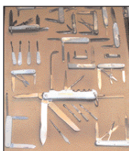
Oggetti particolari del museo come l'attrezzo per salassi, il vecchio cavatappi del nonno e i vecchi Braun.