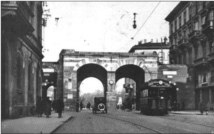
La via Manzoni ancora senza portici (anni '10).